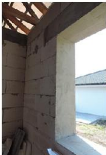
Obrázek č.1 Stavební otvor připravený pro osazení okna do ostění