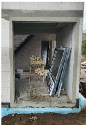
Obrázek č.2 Stavební otvor připravený pro osazení okna do vnějšího líce zdiva a předsazenou montáž